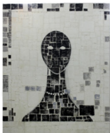
Roberto Diago Sin título Technique mixte sur toile 150 x 120 cm 2017