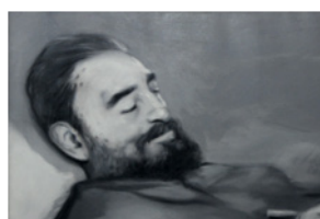
José Angel Toirac Arquiles y Ulises ( Dyptique ) Fidel endormi. Le Che sur son lit de mort. Série Mains Huile sur toile 91 x 60 x 4 cm