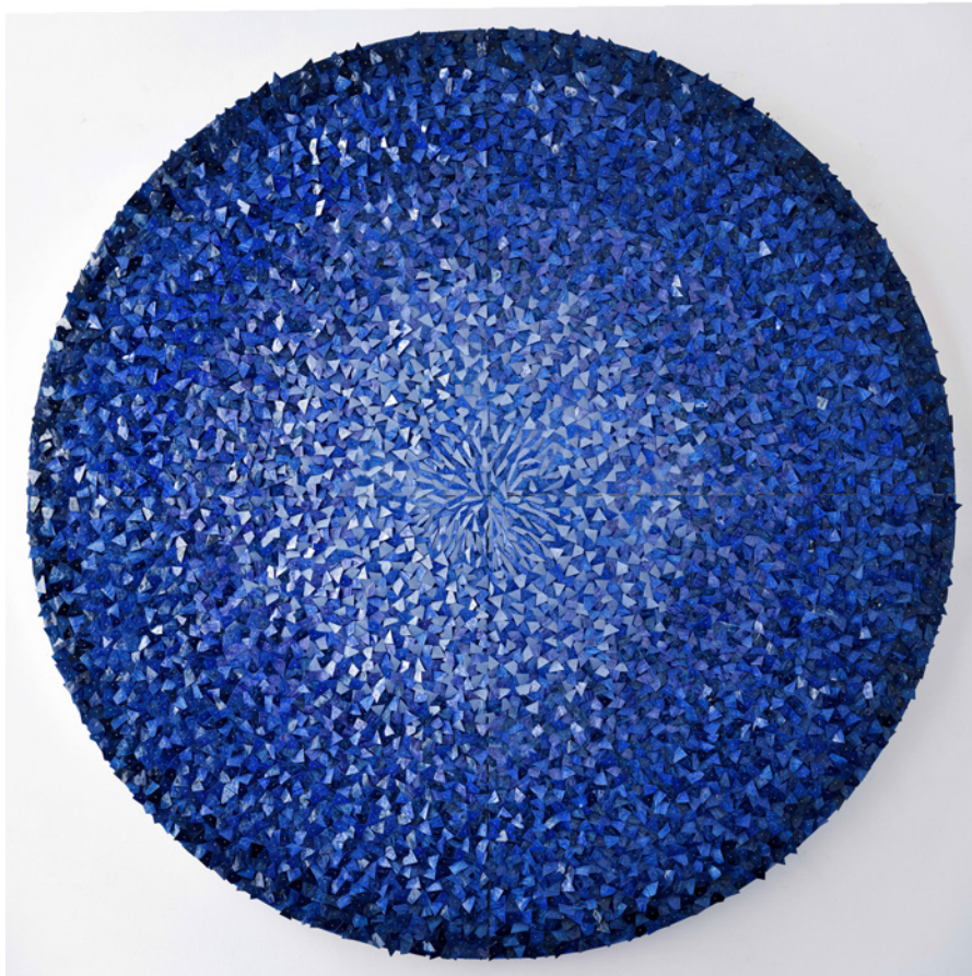
Mabel Poblet Ocean Scape 2018