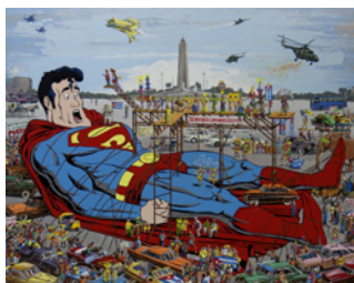
Reynerio Tamayo Gulliver Acrylique sur toile 166 x 200 cm 2015