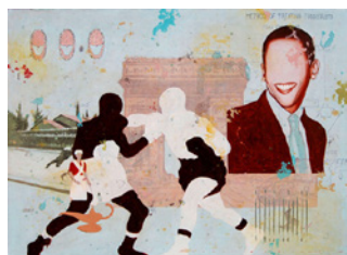
Alexis Esquivel Smile You won ! Acrylique sur toile 146 x 195 cm 2010