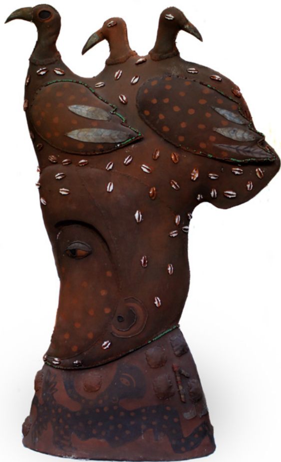
Manuel Mendive Cabezas mágicas 2005