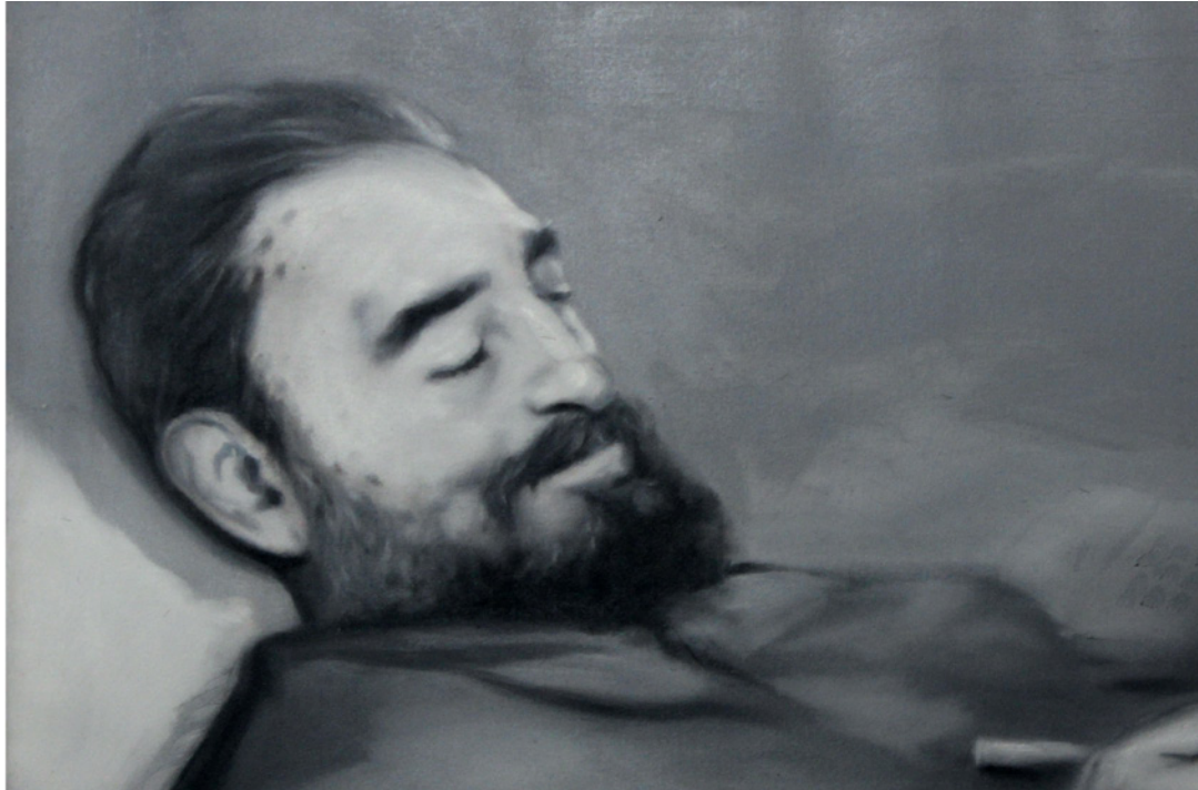
José Angel Toirac Aquiles y Ulises (Détail). Fidel endormi, Le Che sur son lit de mort, série Mains

La richesse de Cuba réside dans sa culture ou plutôt dans ses cultures : espagnoles, françaises, américaines et bien sûr caribéennes. Ainsi l'île est devenue un carrefour pour la littérature, la danse, la musique et le cinéma. L'exposition « Buena Vista, art contemporain à Cuba » présente la vitalité des arts plastiques depuis 1959.