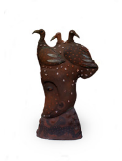
Manuel Mendive Cabezas mágicas Installation 70 x 45 x 110 cm 2005