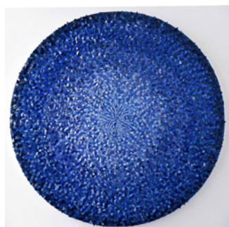
Mabel Poblet Ocean Scape Collage photos sur PVC 80 x 80 x 6 cm 2018