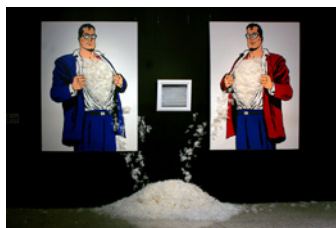
Lázaro Saavedra La difícil travesía de los griegos por la cultura popular y el internet (Le passage difficile des Grecs vers la culture populaire et internet) 2012