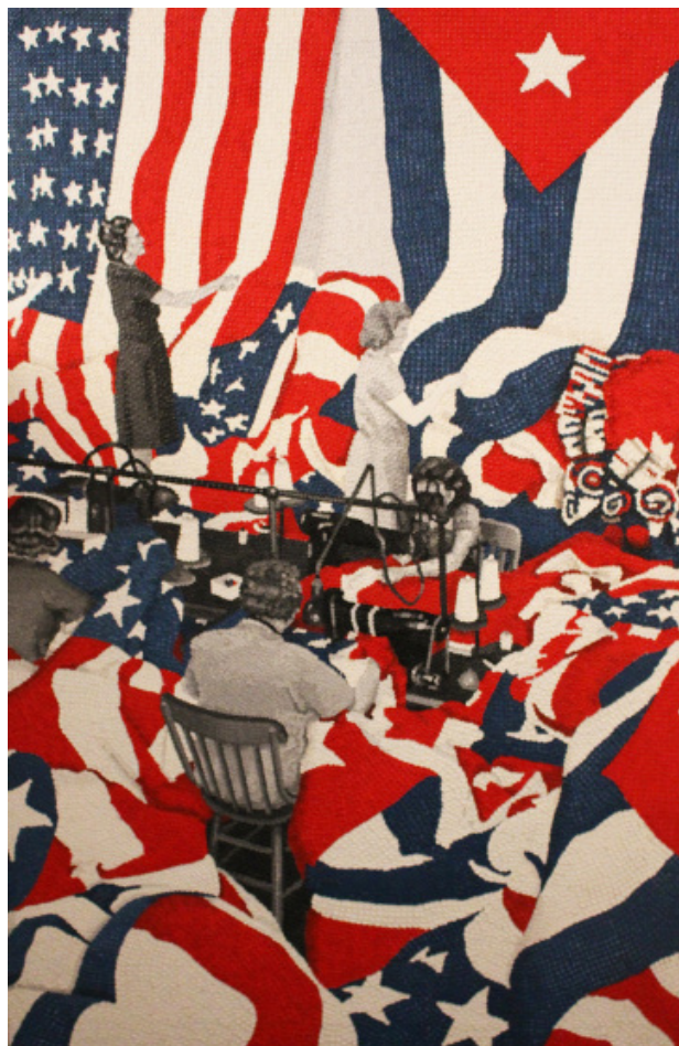
René Francisco Fabrica de Utopias 2006

Son processus de création comporte plusieurs étapes dont le premier est un jeu d'exploration dans lequel elle recueille des fragments de peinture ancienne sur les bâtiments de la ville, telle une « archéologue urbaine ». Son travail n'implique pas de croquis ou de préparation préalable; les résultats sont dictés par les découvertes. La racine conceptuelle de son travail est liée aux actes de vie fortuits et spontanés, en même temps qu'elle nous donne l'histoire de la ville à travers ses pigments.