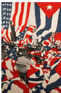
René Francisco Fabrica de Utopias ( Fabrique d'Utopies ) Acrylique sur toile 120 x 80 cm 2006