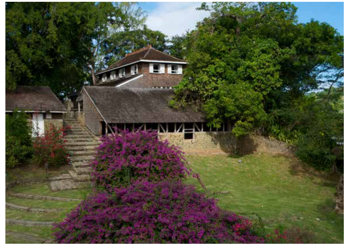
Habitation Clément