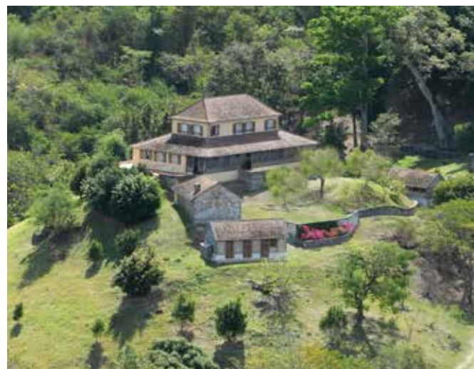
Habitation La Sucrierie