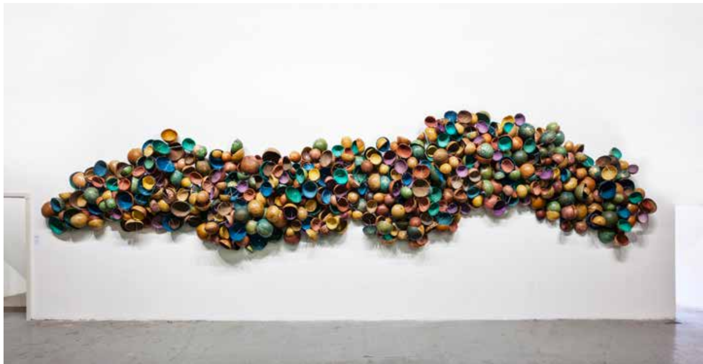
COLORFUL CALABASHES, 2014 Calebasses peintes 9,2 x 2,7 x 0,5 m Vue d'exposition : Update - Galleria Continua / San Gimignano, 2014 Courtesy Galleria Continua, San Gimignano/ Beijing/Les Moulins/Habana. Adagp, 2019

JS : Quel est votre nouveau champ d'exploration ?