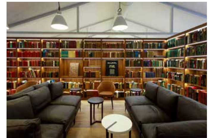
Bibliothèque de la Fondation Clément

En 2016, la Fondation Clément a lancé la parution des cinq premiers volumes de la collection Parcours du patrimoine , qui couvrent 12 communes en partenariat avec la Direction des affaires culturelles de la Martinique et Le Patrimoine des communes de la Guyane qui recense pour la première fois les trésors du territoire guyanais. En 2017, elle publie avec HC édition Patrimoine Guadeloupe , et en 2018 elle complète la collection Parcours du patrimoine avec le volume Eglise du sacré coeur de Balata .