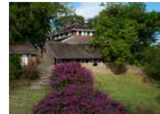
Habitation Clément