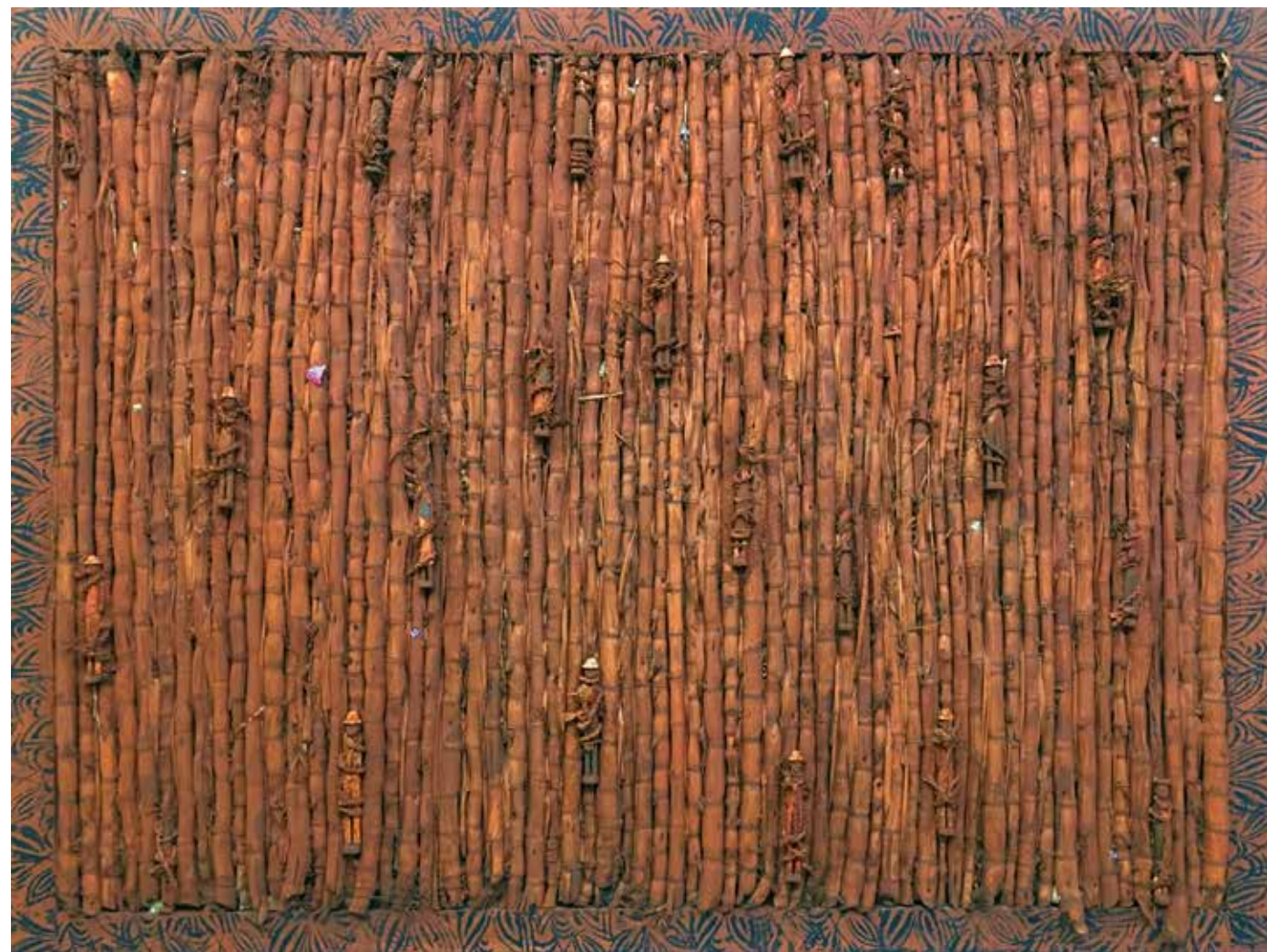
SUGAR CANE A, 2018 Techniques mixtes 165 x 212 x 8 cm Courtesy Galleria Continua, San Gimignano/ Beijing/Les Moulins/Habana. Adagp, 2019

Comment mon langage peut-il embrasser tous les langages du monde ? Mon rêve est de devenir un homme demain, un homme qui m'inspire, pluriel et divers. Lorsque je médite, lorsque je pense à ce devenir, je remplis ma boîte à outils.