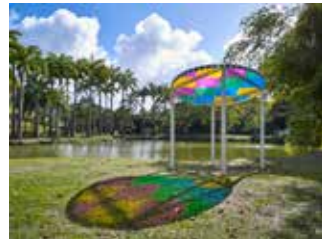
Habitation Clément Jardin des sculptures Daniel Buren, L'Attrape-Soleil