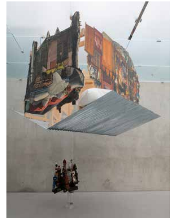
THE FALLING HOUSE, 2014 Tirages photographiques sur bois Environ 3 x 2 x 2 m Vue d'exposition : I Love You! - Kunsthaus Bregenz, 2014 Courtesy Galleria Continua, San Gimignano/Beijing/Les Moulins/Habana. Adagp, 2019