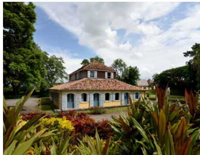
Habitation Pécou

Ces habitations, qui ont respectivement rejoint l'ensemble patrimonial géré par la Fondation Clément en 2001 et en 2002, sont ouvertes chaque année à l'occasion des Journées européennes du patrimoine. Elles reçoivent en moyenne 1700 visiteurs.