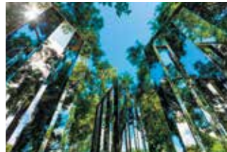
Habitation Clément Jardin des sculptures Jeppe Hein, Dimensional Mirror