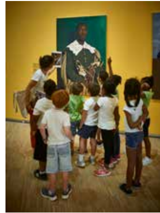
Fondation Clément Médiation de l'exposition Afriques, artistes d'hier et d'aujourd'hui. Œuvre : Juan de Pareja de Omar Victor Diop