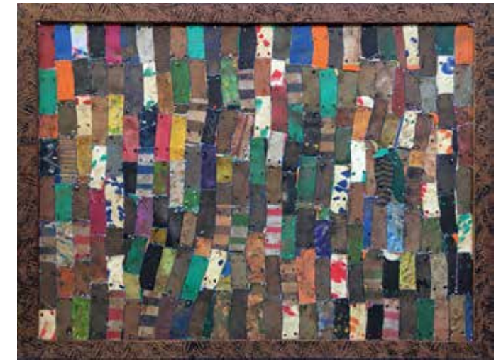
ESEKA B, 2016 Technique mixte 166 x 212 x 8 cm Courtesy Galleria Continua, San Gimignano/Beijing/Les Moulins/Habana. Adagp, 2019