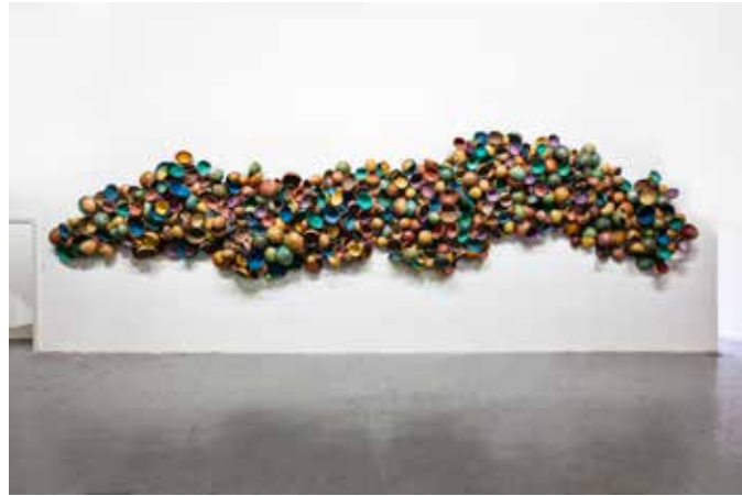
COLORFUL CALABASHES, 2014 Calebasses peintes 9,2 x 2,7 x 0,5 m Vue d'exposition : Update - Galleria Continua / San Gimignano, 2014 Courtesy Galleria Continua, San Gimignano/Beijing/Les Moulins/Habana. Adagp, 2019