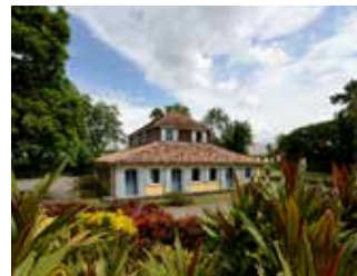
Habitation Pécoul