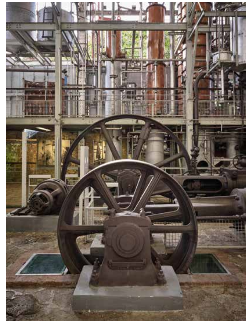
Habitation Clément Ancienne distillerie