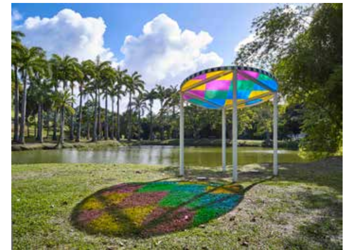
Habitation Clément Jardin des sculptures Daniel Buren, L'Attrape-Soleil