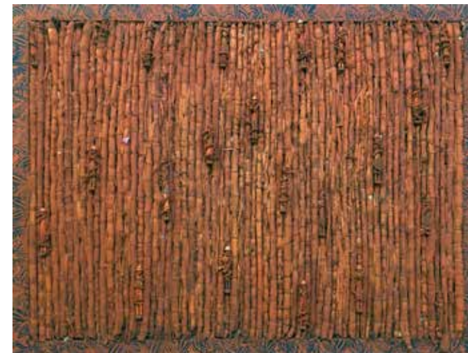
SUGAR CANE A, 2018 Techniques mixtes 165 x 212 x 8 cm