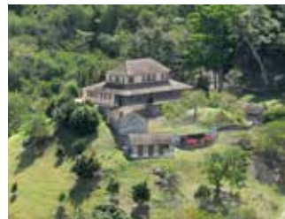
Habitation La Sucrierie