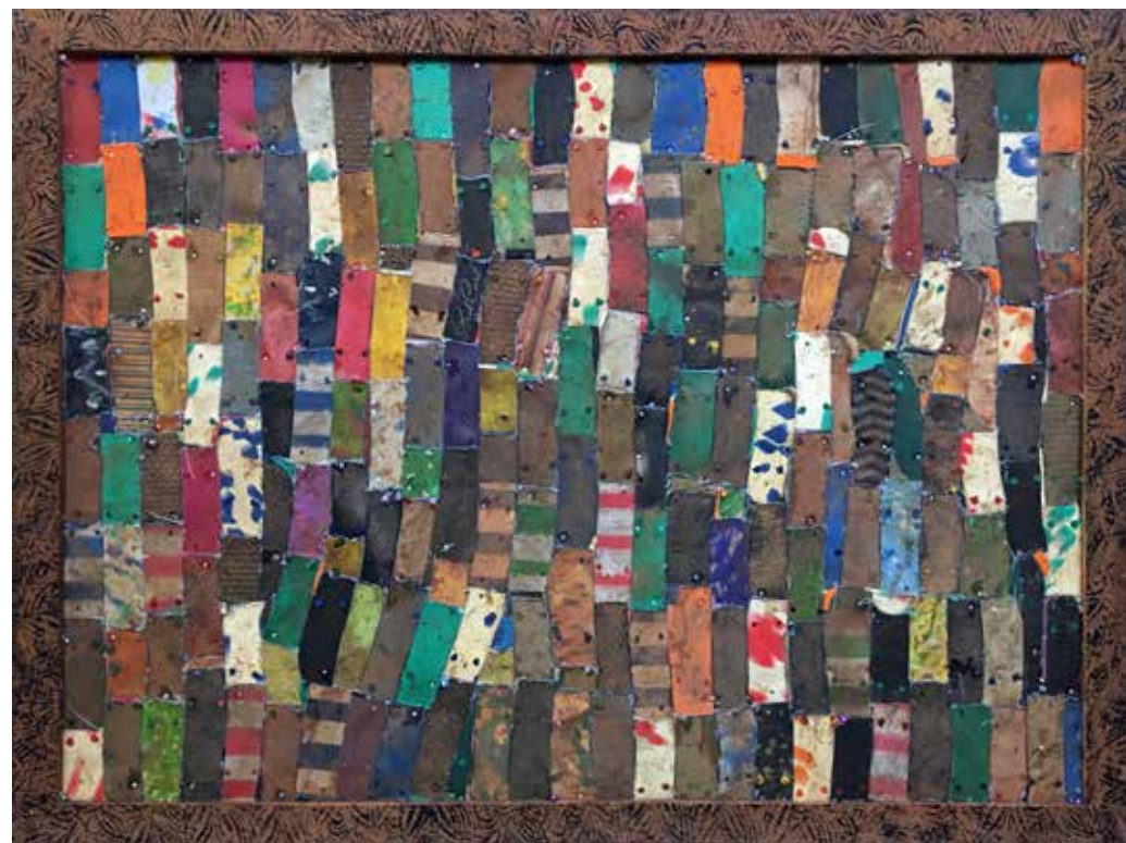
ESEKA B, 2016 Technique mixte 166 x 212 x 8 cm Courtesy Galleria Continua, San Gimignano/ Beijing/Les Moulins/Habana. Adagp, 2019