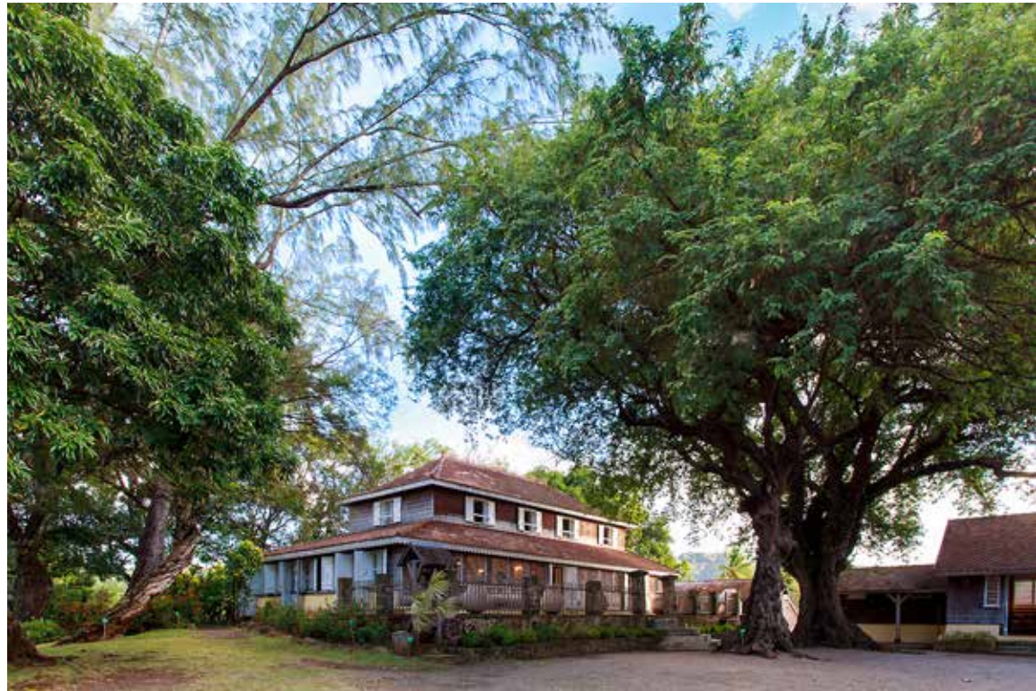
Habitation Clément La maison principale