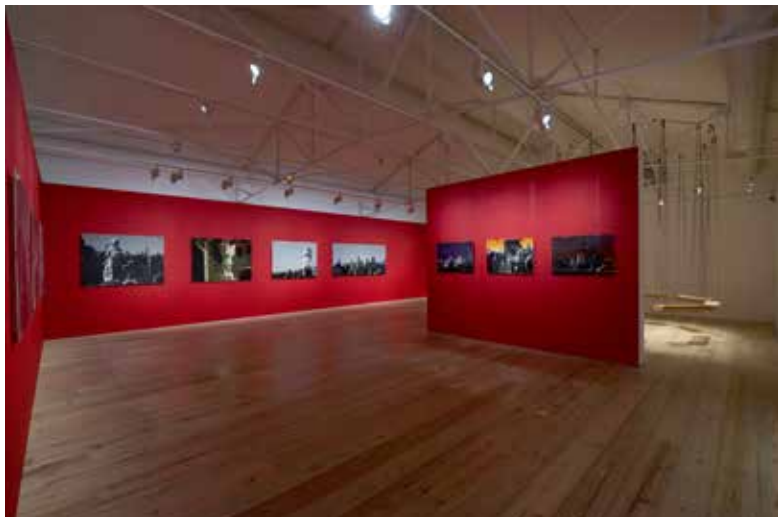
Fondation Clément La Cuverie Exposition collective | De lo real a lo imaginario