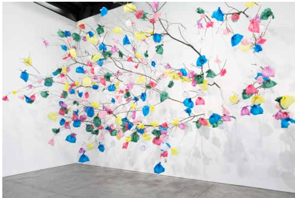
PLASTIC TREE, 2014-2018 Branches, sacs plastiques Dimensions variables