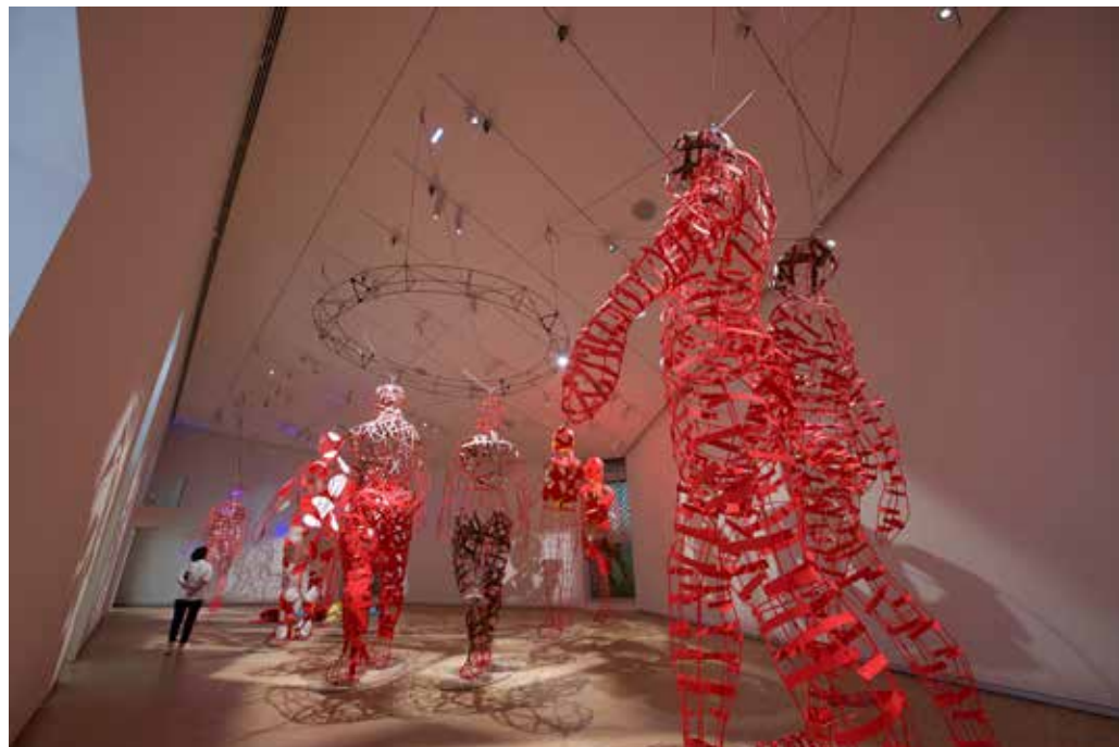
Fondation Clément La nef Exposition Hervé Beuze | Armature Photo Gérard Germain