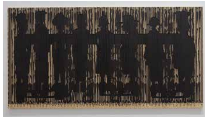
CODE NOIR, 2018 Peinture sur panneau 150 x 290 cm Vue d'exposition : Colorful Line - Richard Taittinger Gallery, New-York, USA, 2018 Adagp, 2019