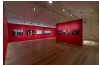
Fondation Clément La Cuverie Exposition collective | De lo real a lo imaginario