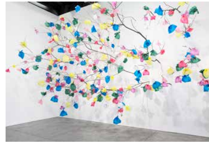
PLASTIC TREE, 2014-2018 Branches, sacs plastiques Dimensions variables Courtesy Galleria Continua, San Gimignano/Beijing/Les Moulins/Habana. Adagp, 2019