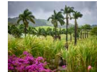
Habitation Clément