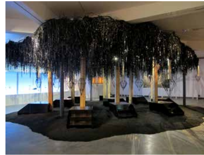
DIAMONDSCAPE, 2012 Bois, formica, métal, chaînes, résine, moteurs, câbles, bandes magnétiques Dimensions variables Courtesy Galleria Continua, San Gimignano/Beijing/Les Moulins/Habana. Adagp, 2019