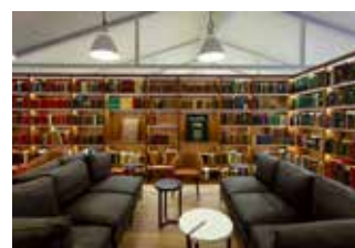
Bibliothèque de la Fondation Clément