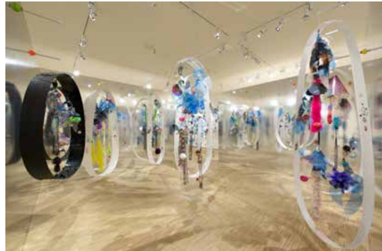
Fondation Clément La salle Carrée Exposition Ernest Breleur | Le vivant, passage par le féminin