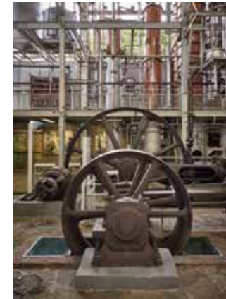
Habitation Clément Ancienne distillerie