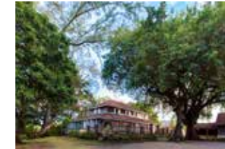
Habitation Clément La maison principale