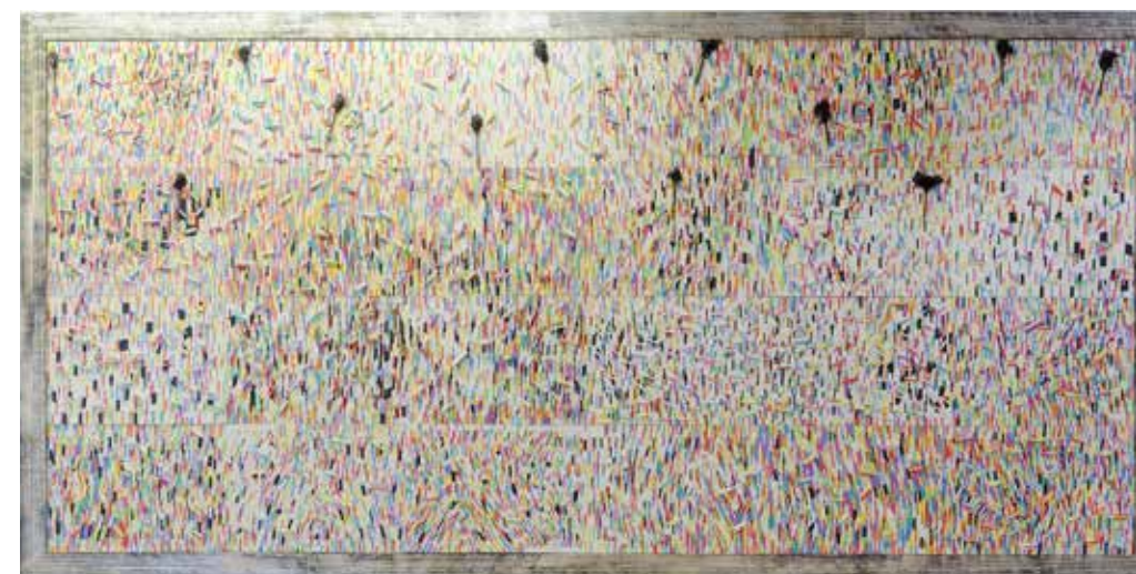
CHALK FRESKO, 2015 Panneaux de craies 313 x 624 cm Vue d'exposition : Gri-Gri, VNH Gallery, Paris, 2015 Adagp, 2019

PMT : Nous avons créé des codes et des symboles parmi lesquels j'ai choisi certains, afin d'exprimer le dégoût, parfois envers moi-même et le monde. Je ne veux pas créer une religion. Pour moi, l'unique religion qui a de la valeur est l'humain dans toute sa diversité. C'est un constat. Puis, de ce constat, j'utilise des mots et des symboles universels pour raconter une histoire, a priori belle, mais qui renferme également une part sombre. Finalement, cela revient à affirmer qu'au fond nous sommes tous identiques. La survie de l'Homme réside dans sa créativité. Lorsque je pense à cela, je rêve d'une nouvelle session humaniste, qui accompagnerait mon rêve absolu, celui d'être un Homme.