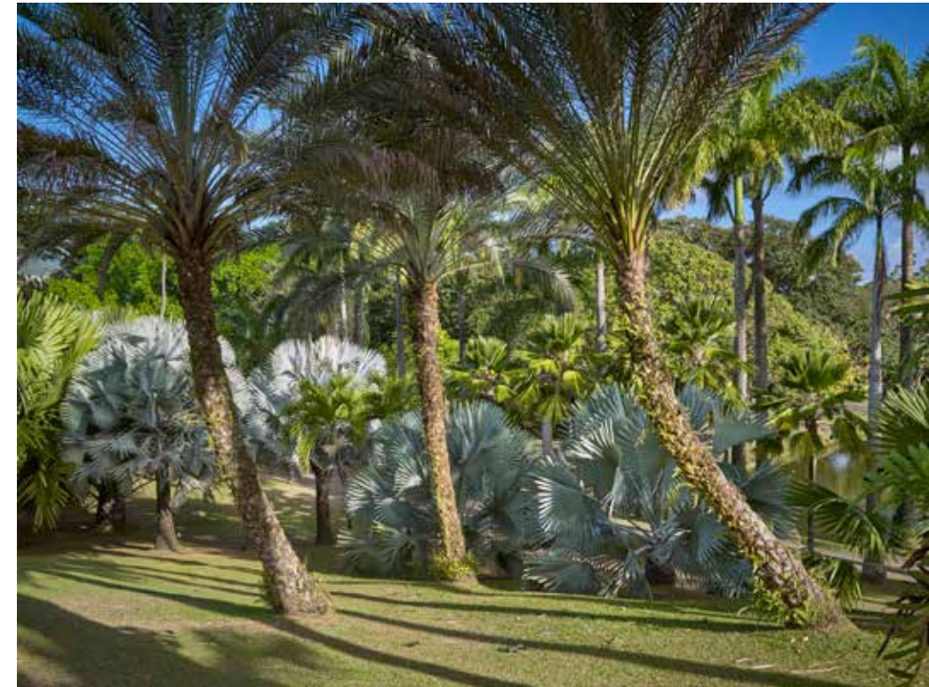
Habitation Clément La palmeraie