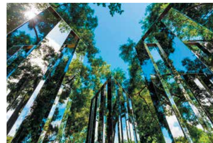
Habitation Clément Jardin des sculptures Jeppe Hein, Dimensional Mirror, Photo Jean-François Gouait