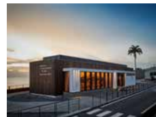
Mémorial de la Catastrophe de 1902 | Musée Frank A. Perret