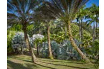
Habitation Clément La palmeraie