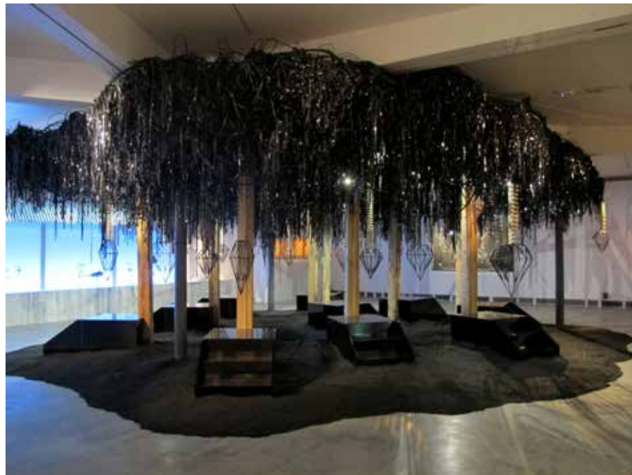
DIAMONDSCAPE, 2012 Bois, formica, metal, chaînes, résine, moteurs, cables, bandes magnétiques Dimensions variables.

dans l'intimité de la vie de l'artiste, qui transporte à la Fondation Clément, des lieux qui lui sont chers comme son pays natal, le Cameroun à travers une série de photographies de scènes de cérémonies comme autant de souvenirs. Il nous emmène jusqu'à la maison de sa mère, ce cocon familial, auquel il rend hommage dans un grand papier peint intitulé Hakunamatata (2019) et un tableau tiré de La Cour de ma mère (2013), une vision de cette dernière balayant sa cour dans son village natal. Selon Tayou, « la maison est le portrait de la vie. C'est une autre facette de notre identité 2 ». Son parcours découle souvent de cet horizon intimiste, à commencer par son nom, Pascal étant le prénom de son père et Marthine de sa mère. Depuis son « départ » du Cameroun il y a une vingtaine d'années, Pascale Marthine Tayou a pris l'habitude d'y retourner tous les ans. Dans ses œuvres, l'artiste fait toujours référence de manières implicites et récurrentes à ses origines, à la terre rouge et nourricière du Cameroun comme dans ses grands tableaux en terre intitulés Boboland (2013) ou Terres riches (2013). « Le Cameroun est ma marque déposée, c'est ma base initiatique 3 » explique-t-il.