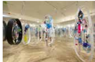
Fondation Clément La salle Carrée Exposition Ernest Breleur | Le vivant, passage par le féminin