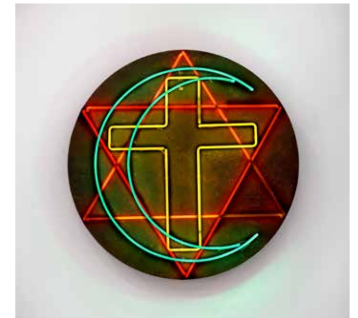
DAVID CROSSING THE MOON, 2015 neon 20 x Ø 180 cm Vue d'exposition : BOOMERANG Serpentine Gallery, London, UK, 2014