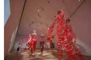
Fondation Clément La nef Exposition Hervé Beuze | Armature