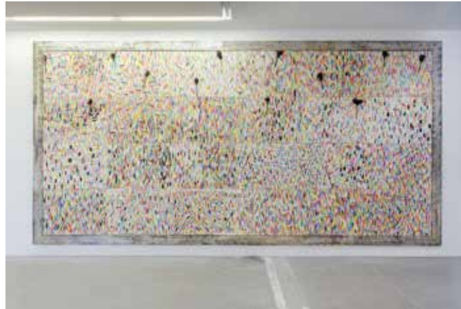
CHALK FRESKO, 2015 Panneaux de craies 313 x 624 cm Vue d'exposition : Gri-Gri, VNH Gallery, Paris, 2015 Adagp, 2019