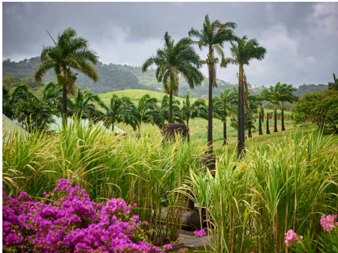
Habitation Clément