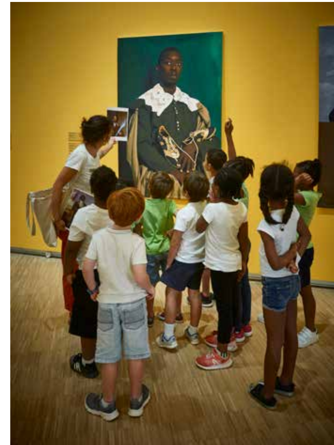
Fondation Clément Médiation de l'exposition Afriques, artistes d'hier et d'aujourd'hui. Œuvre : Juan de Pareja de Omar Victor Diop