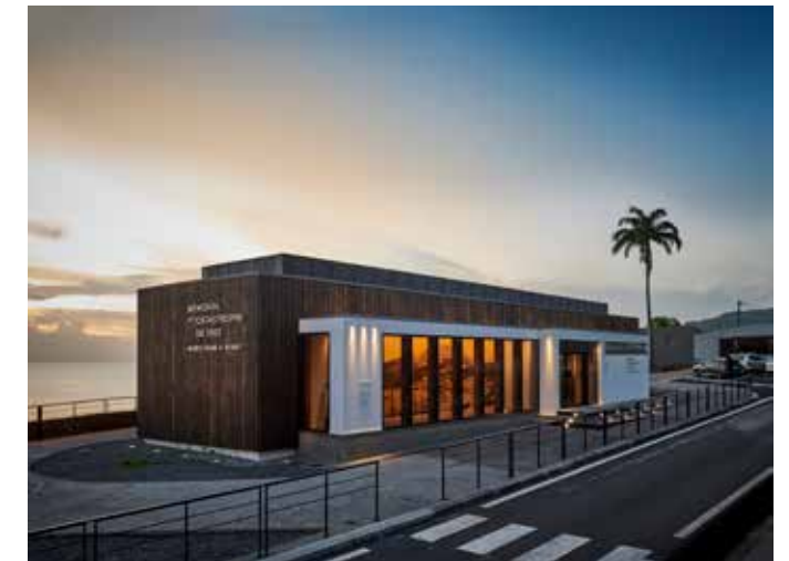
Mémorial de la Catastrophe de 1902 | Musée Frank A. Perret