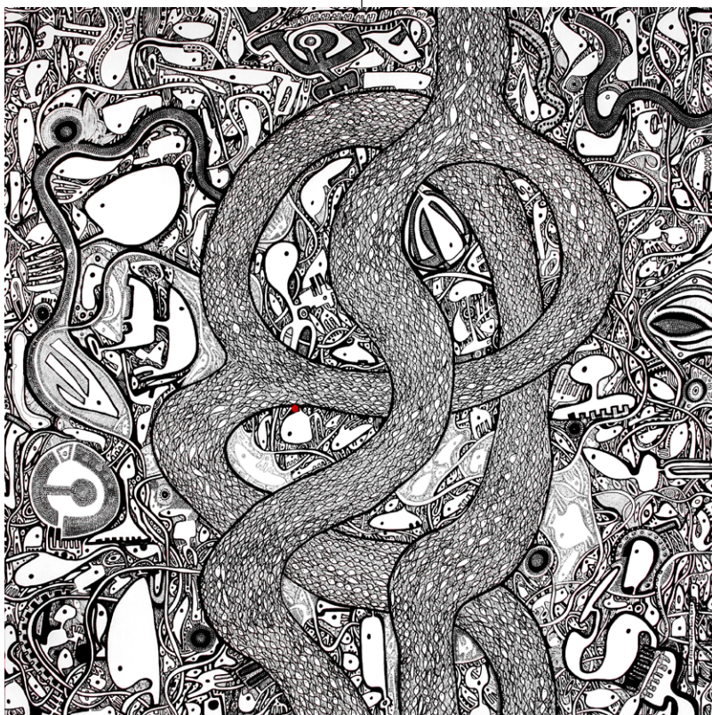
Ricardo Ozier-Lafontaine Sans titre 2 , issu de la série Le vivant 2015 Acrylique sur toile 200 x 200 cm

Le verbe reset en anglais a plusieurs sens allant de la réinitialisation d'un ordinateur à la réduction d'une fracture. Il évoque pour Ricardo Ozier-Lafontaine, deux notions intimement liées dans son œuvre : l'origine et la guérison. RESET est une cosmogonie, un récit de la création de l'univers, qui permet autant d'expliquer que de régénérer le monde. Partant du dessin automatique, porté par une sorte de transe artistique, l'artiste réalise un travail à la fois acharné, minutieux et intuitif. Emergent ainsi des mémoires oubliées, de ressentis intimes, formant le récit de la lutte entre la lumière et l'obscurité, entre l'ordre et le désordre. Le désordre du monde est peut-être celui du cosmos ou peut-être celui intime de l'artiste.